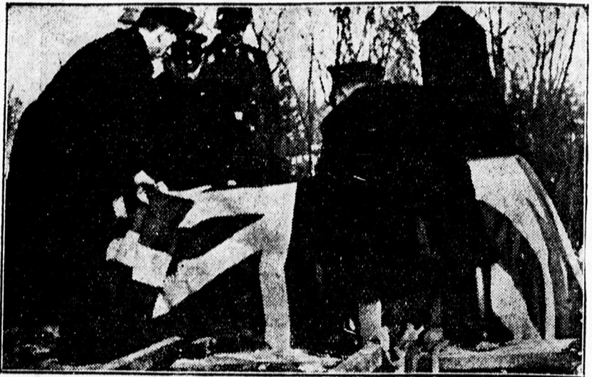
Pilóta temetés a nyugati fronton.