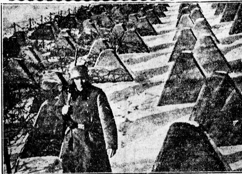
Pillanatképfelvétel a nyugati frontról.

Az értelmiségi munkanélküliség ügyeinek kormánybiztosa a baromfi, tojás és lőtt vad export szakmában a Hangya szövetkezet kebelén belül megüresedett állások betöltéséhez szükséges elméleti és gyakorlati szakismeretek elsajátítása céljából átképző tanfolyamot tervez. A tanfolyam, amelyre 25 hallgatót vesznek fel, 9 hónapig tart és elméleti-gyakorlati részből áll. A tanfolyamot sikerrel elvégzett hallgatók alkalmazását a Hangya telepház leg-alább 150 pengő havi kezdőfizetéssel biztosítják. A tanfolyamra felvételre szóló kérvényeket március 31-ig