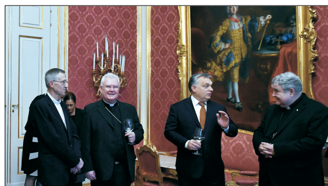
A találkozón részt vett Orbán Viktor miniszterelnök is