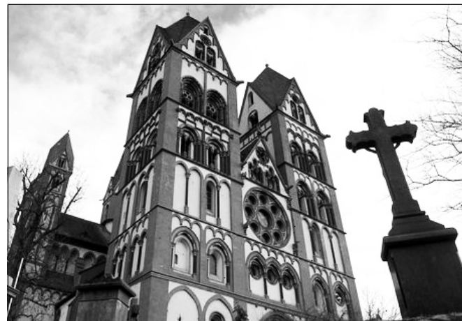
A felszámolt templomok területi eloszlása egyenlőtlen