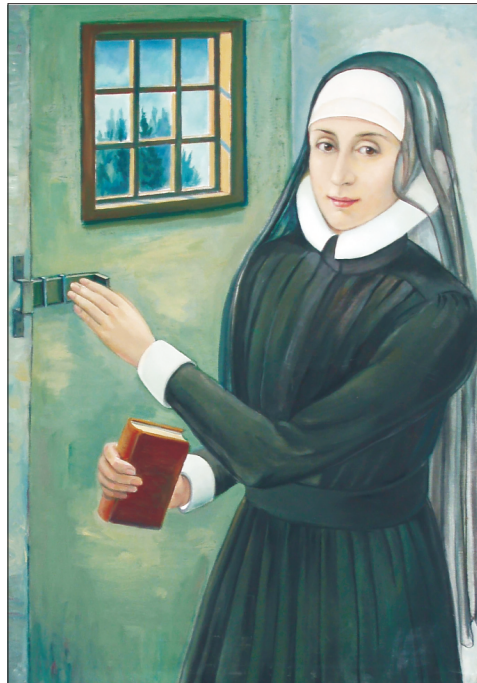
Ward Mária Ünnepe: január 23.

1585. január 23-án született, amikor I. Erzsébet idejében a katolikusokat elkese-redetten üldözték. (...)