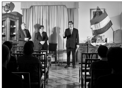
Szent Miklós-napi ünnep Rómában

A Rómában élő magyar papok, papnövendékek, szerzetes és szerzetesnők hagyományos Szent Miklós-napi ünnepülésükre gyűltek össze december 5-én a Pápai Magyar Intézetben.