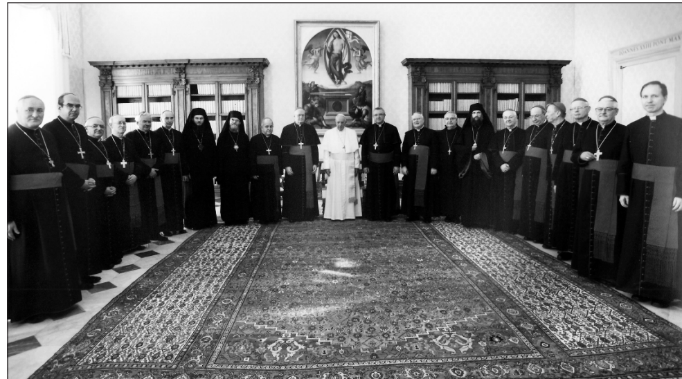
A Magyar Katolikus Püspöki Konferencia tagjai a Szentatyánál

Az ad limina látogatáson Rómában tartózkodó magyar püspökök november 21-én este meglátogatták a Püspöki Kon-