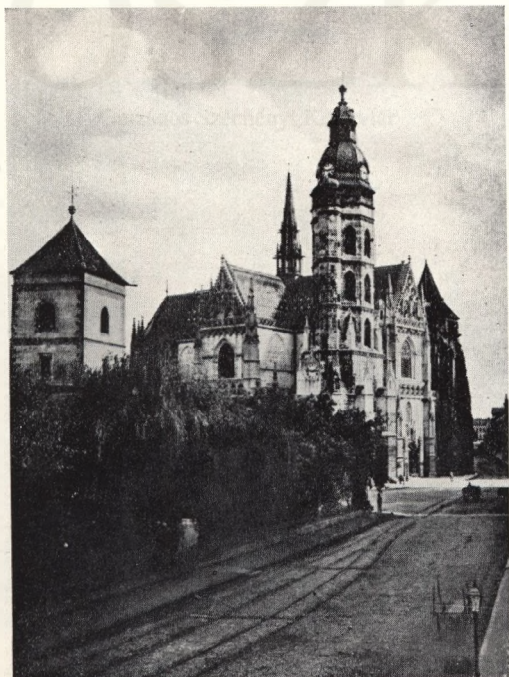
Ansicht des Domes von südwestlicher Richtung