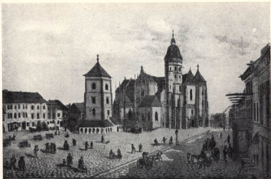
Ansicht des Marktes um 1830 — Aquarell von Jakob Alt