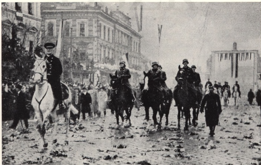
Einzug des Reichsverwesers und der Honvéd am 11. Nov. 1938.