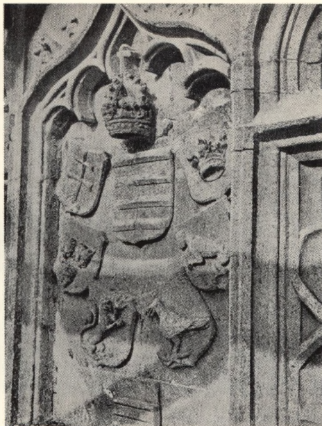
Reichswappengruppe König Matthias' Corvinus an dem südlichen Giebel des Doms