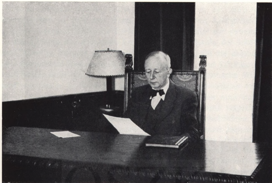
Der Leiter des Institutes, Prof. Dr. Hans Freyer in seinem Arbeitszimmer.