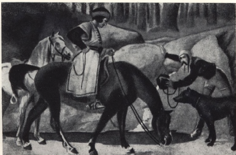
Der Dichter und Feldherr N. Zrinyi auf der Jagd.