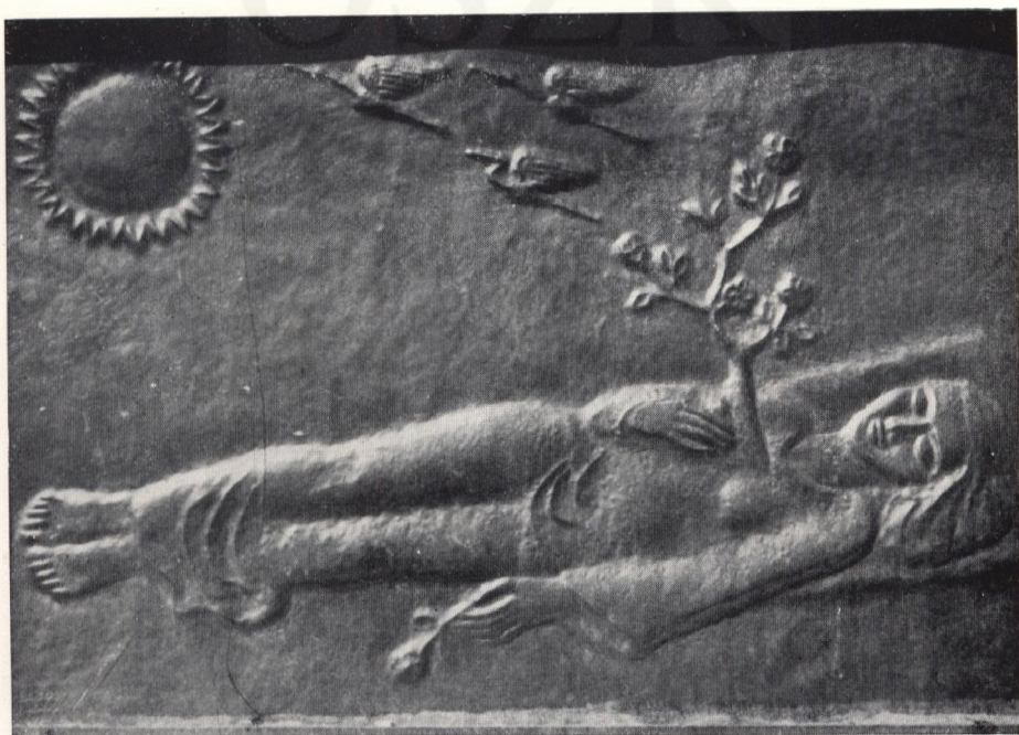
Grabmal einer jungen Frau.