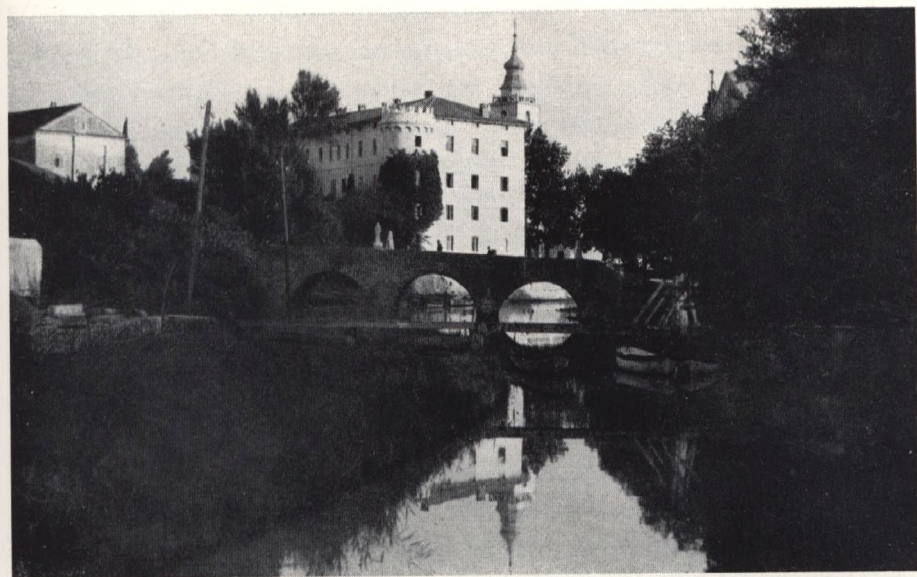
Altes ungarisches Paulinerkloster in Crikvenica.