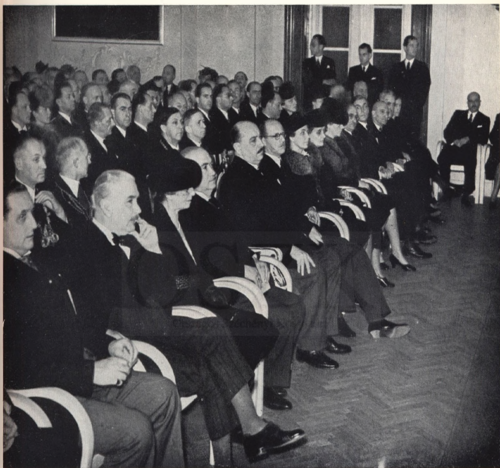
Hervorragende Vertreter der deutschen und ungarischen Kulturpolitik an der Eröffnungsfeier des Deutschen Wissenschaftlichen Institutes in Budapest.