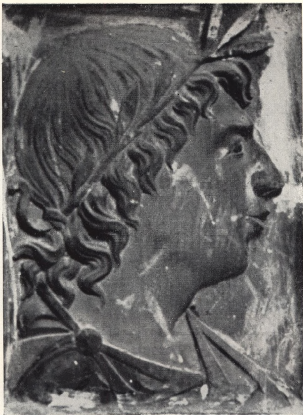
Zeitgenössisches Marmorbildnis König Matthias' in Trogir.