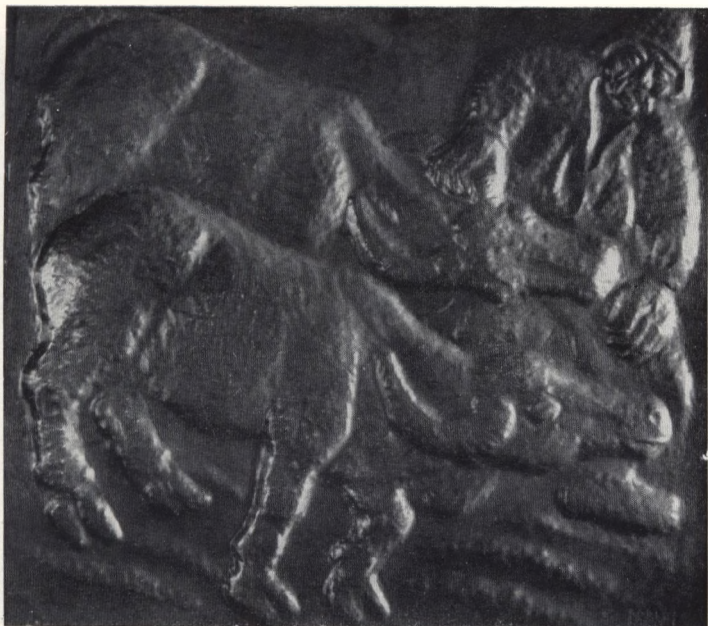
Mann mit Büffeln.