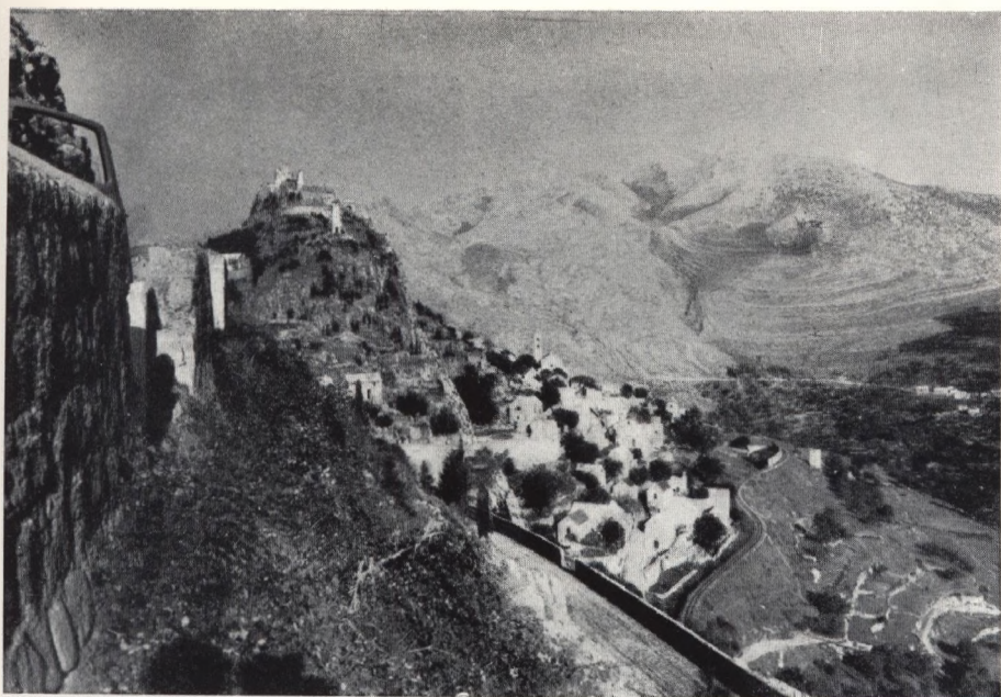
Die Burg Klis, Zufluchtstätte des ungarischen Hofes während des Tartareneinfalls.