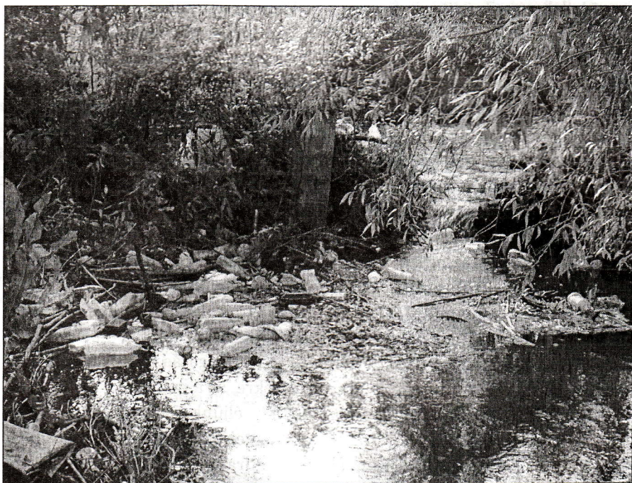
Az Olt Csikjenőfalván. „Idegenforgalmai látványosság”