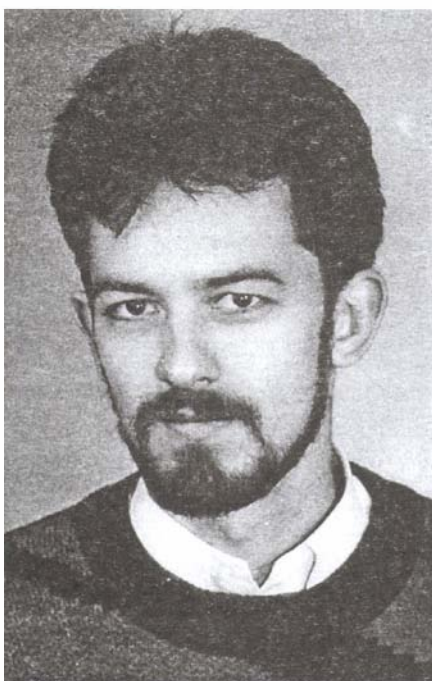
Vörös Alpar, a vallás- és köznevelési miniszter és oktatásügyi kérdésekért felelős tanácsos

kodniuk, módosító javaslatokat kell megfogalmazniuk és felterjeszteniük a minisztériumhoz és a Parlamenthez, hogy ezeket