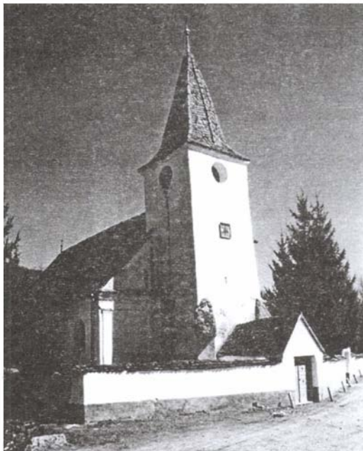
Kétszázadik születésnapját ünnepli a ravai templom

A Kis-Küküllő mellékvölgyében fekvő Rava közepén álló templom alapzata és tornya középkori eredetű. A templomot az 1804. évben építették, de az utolsó simitásokat 1805-ben végezték el rajta. Amikor 1804-ben a régi templomot lebontották, hogy helyette