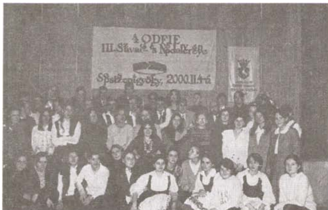
A III. ODFIE szavaló- és népdalverseny résztvevői