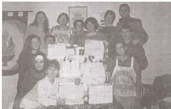
A szörványgyermek karácsonyi csomagjainak összeállítása