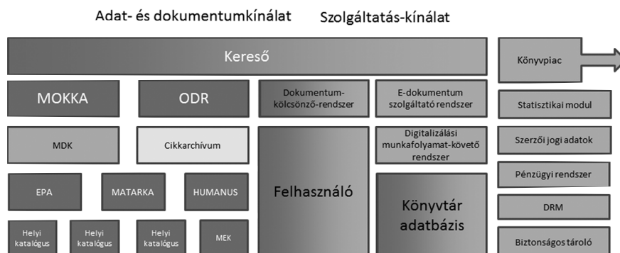
1. ábra. Az Országos Dokumentum-ellátási Rendszer (ODR) átalakulása az ELDORADO rendszer megvalósulása után 8

Az ODR rendszer adatkínálatának alapját az országos szolgáltatáshoz kapcsolódó könyvtárak biztosítják. Jelenleg több mint ötven tagkönyvtára van az ODR rendszernek. 9 Jelen beszámolóban nem feladata, hogy áttekintést adjon a hazai könyvtári digitalizálásról és elektronikus dokumentumszolgáltatásról, de rövid összefoglalást azért kell tennünk, hogy világos legyen a megvalósítandó OEDR helye.