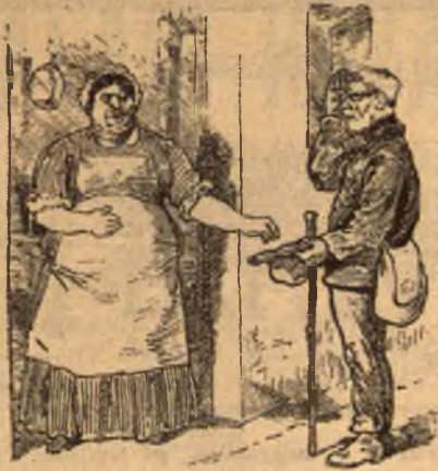
Urhölgy (vastag hangu). Fogja, jó ember. Valkódus (kiszolgált katona) Köszönöm alásan, vitéz öbester ur.