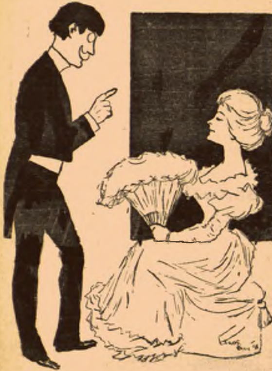
Hölgy. — Gyalázatos, rossz idő van. Udvarló. — Jobb, mintha semilyen se volna.