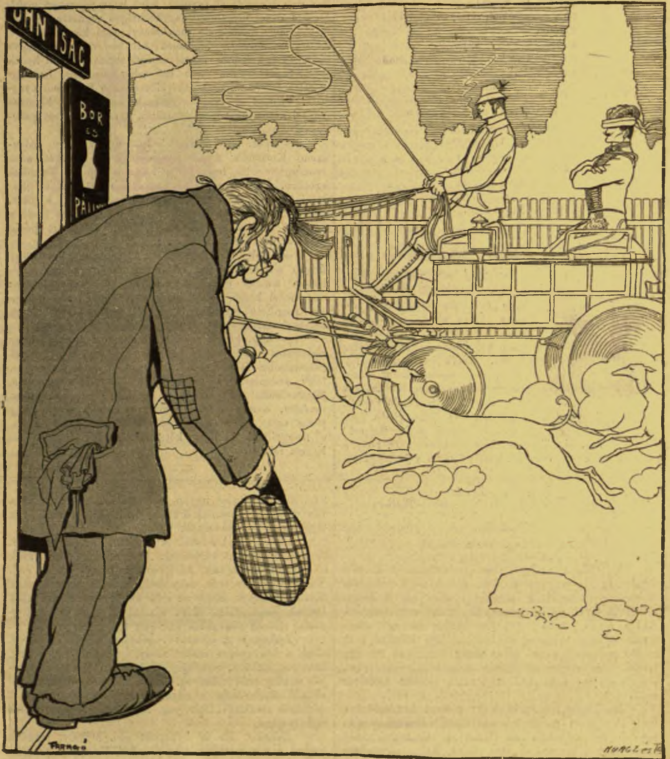
A hitelező és az adós.