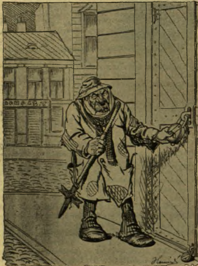
Az utolsó budapesti bakter.