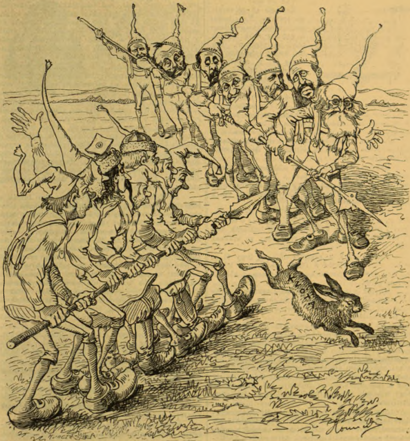
A 7 német svábról és a 7 magyar svábról, akik elindulának a nyulacska ellen, hogy elfognák.