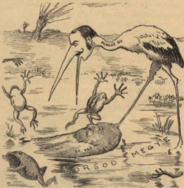
Töke-főispány után a golya-főispány.