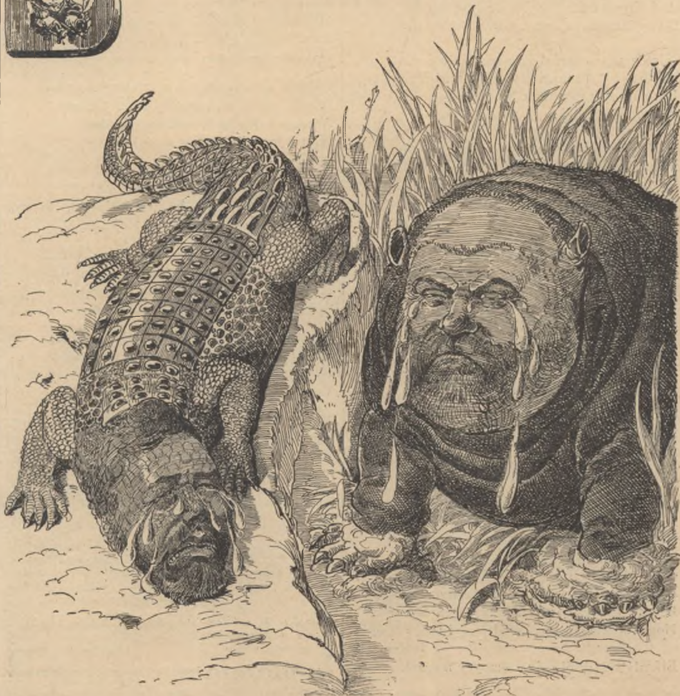
Könnyező viziló és siró krokodilus.

Előfizethetni a kiadó-hivatalban : Budapest, Ferenciek-tere 3. sz. Előfizetési díj : Egész évre 8 frt. — Félévre 4 frt. — Negyedévre 2 frt.