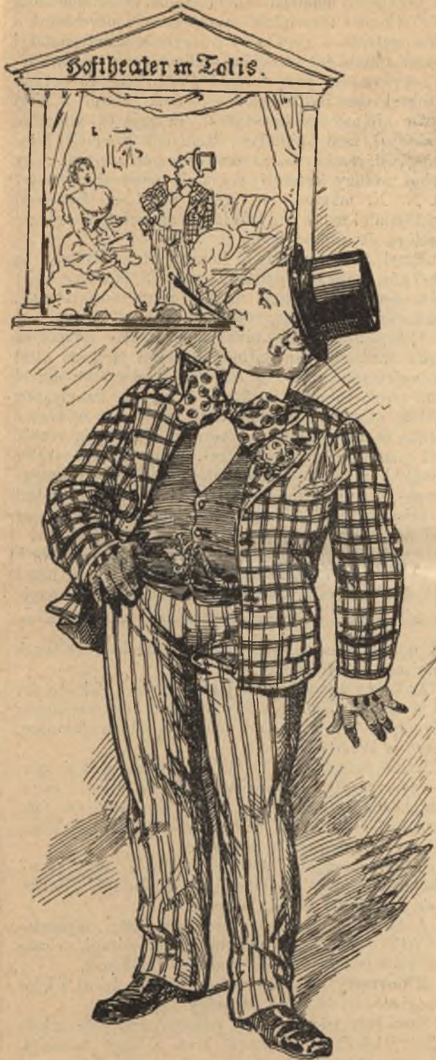
Itthon mint a Herr von Bitz