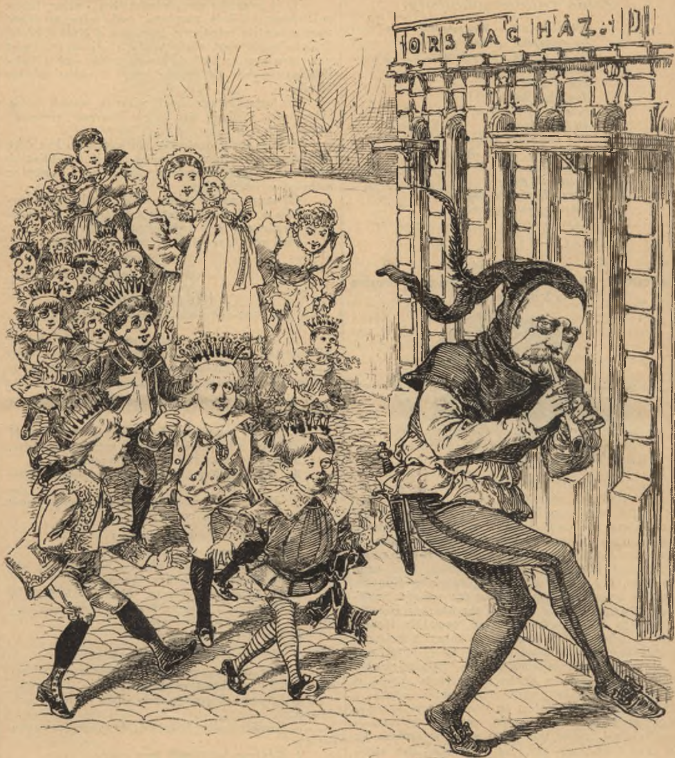
A hamelni patkányfogó Magyarországon.