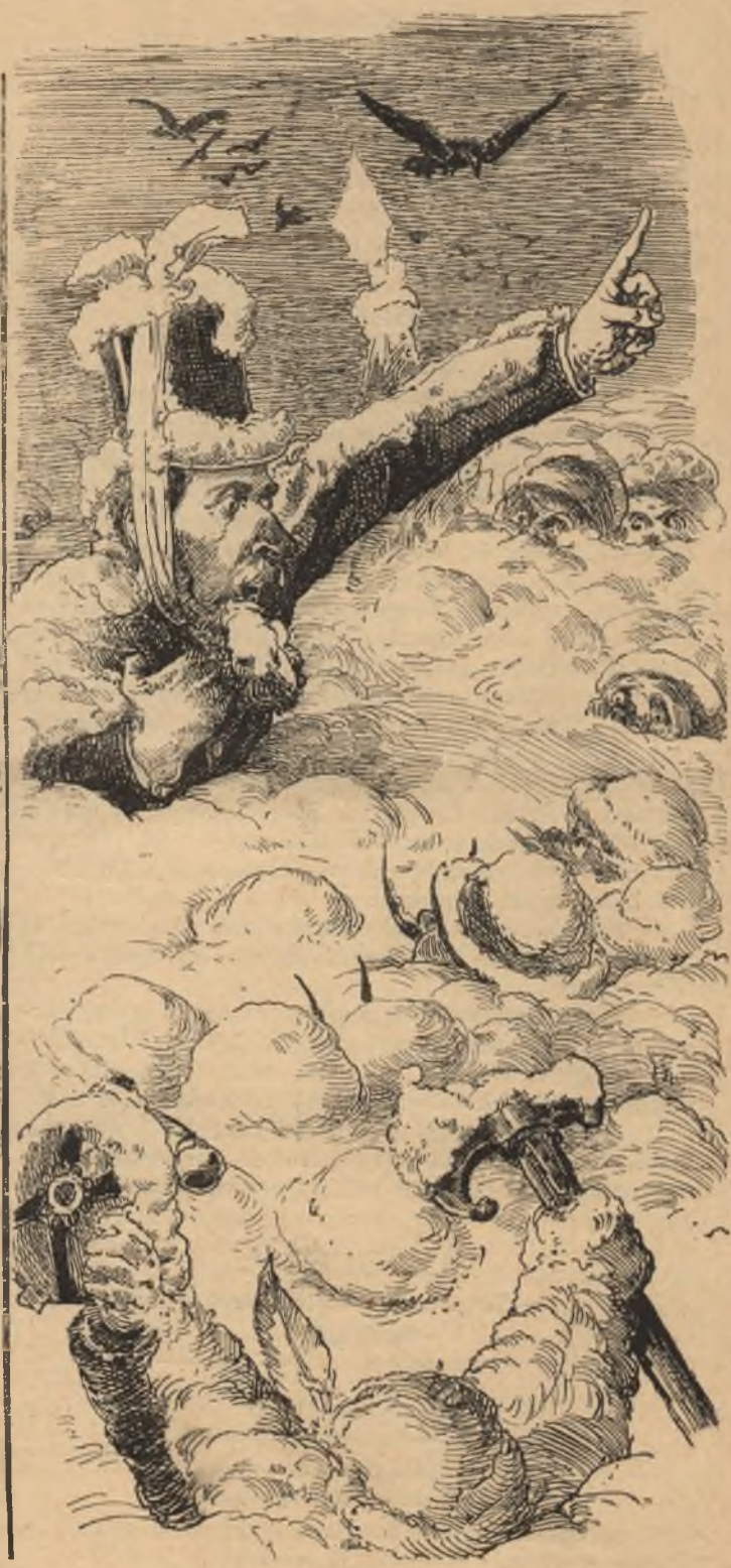
A havas ember.