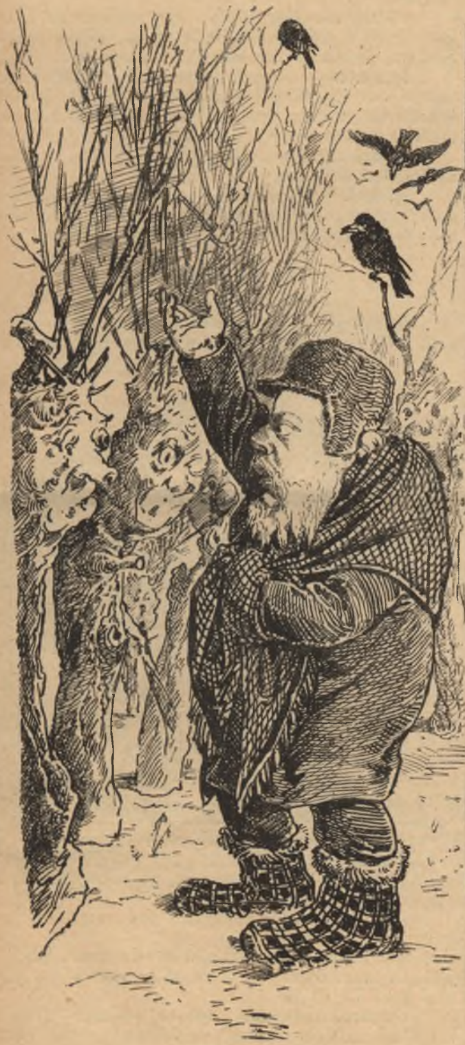
A jeges ember.

— Jelenetek a várható kritikus napok alatt. —