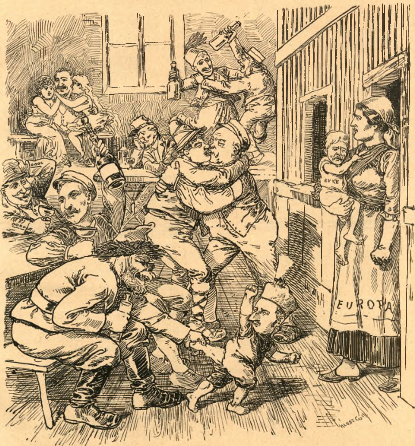
Csaplárosné. Az ördög bujt belétek, garázda fiengkók?! Megint felköltöttétek a gyerekeimet! Még elpusztítjátok szegényt ezzel a pokoli lármával!