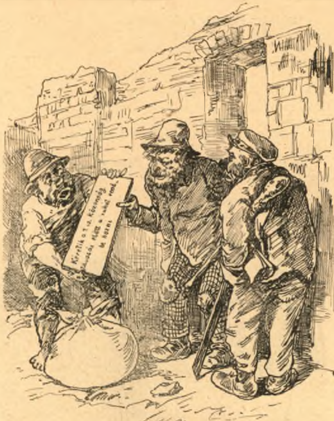
Harmadik betörő. Ehun van ni!