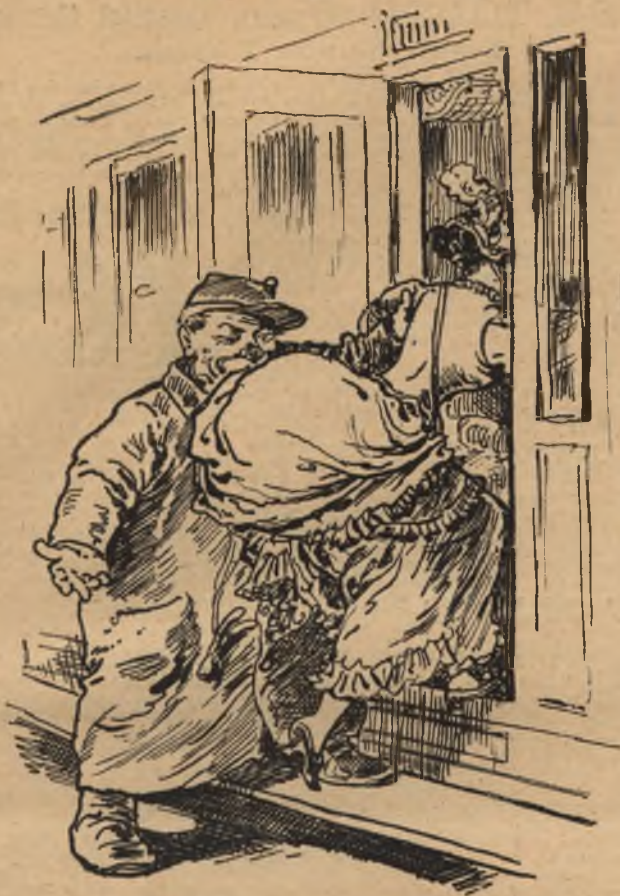
Pokrócz Ádám. Ez oszt' a puffer!