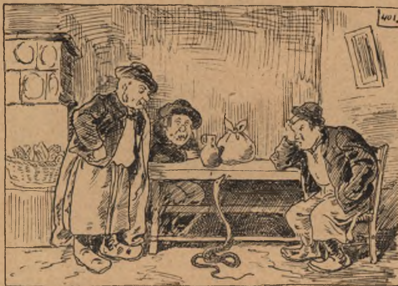
Blaskovits Ferencz: »Tánczó csörgő kigyó az alföldön.«