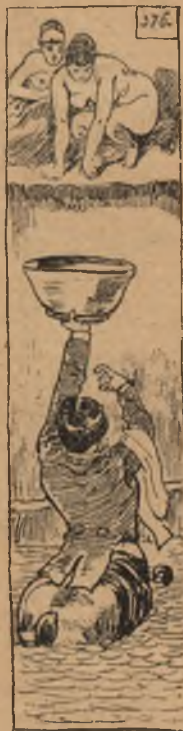
Kardos Gyula: »A szolgálatkész steward, vagyis tengeri pinczér.«