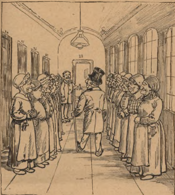
Mikor a hygiénikus kongresszus tagja —