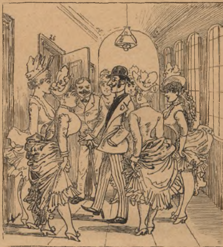
— meg mikor fővárosi ur látogatja.