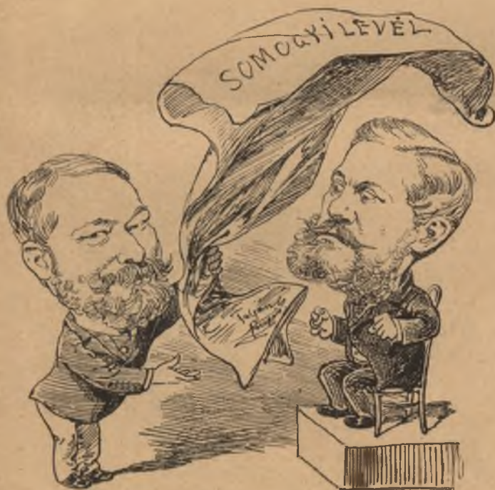
Még egy monumentális leleplezés.

Apokryph, vagy nem az? Ha nem, úgy ki a gaz? Ki az, ki dobra verte? Ki az, ki mindazt tenni merte? Mit bűnnek bélyegez a törvény, Való-e az erkölcsi örvény? Mely ha való: a nép Elvész, míg az urnák elébe lép. Mert ott nem a jog s törvény öre várja, Hanem a lelkek becstelen kufárja! Apokryph a jelentés, vagy nem az? Ha az, ki volt a gaz? Ki főzte ki e rút rágalmakat? És lesz-e sorsa börtön és lakat? S ha az irat való: Ah! úgy ki volt a ló, Aki egy ilyen iratot Könnyelműn tolvajprédának hagyott? Ezer kérdés maradjon nyitva bár, Az bizonyos: van egy gaz, s egy számár.