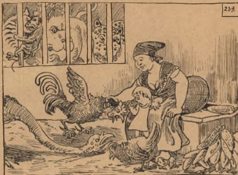
Szirmai Antal. »Spártai nevelés.« (A kakas vonakodván megcsipni a kis hőst, a tegeri kigyópulyka közeledik, hogy megszoktassa Lakedémon reménységét az ijedéstől.)