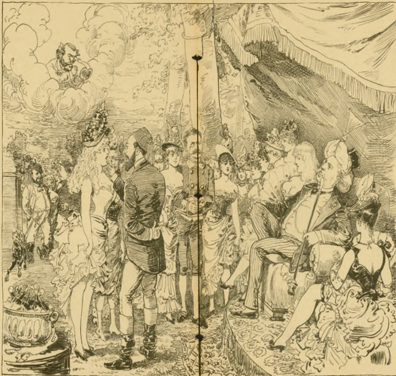
M. B. Czoki András! Ha az ott a Kecsesi baka... én meg magam vagyok a Kecseső szultán!

— Sz. István napi székelyi szilárdítást a férj-szolgálat —