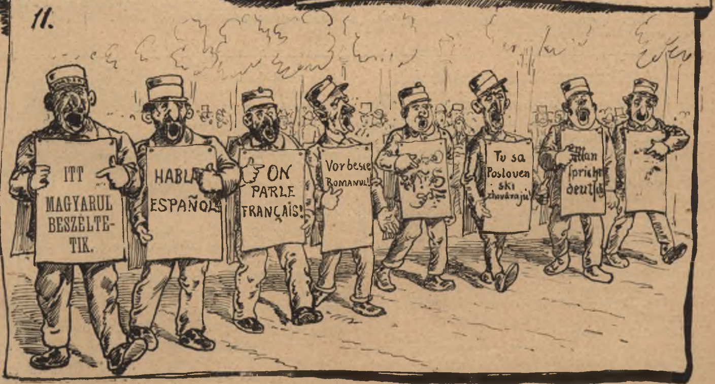
9. Megérkezés az osztr. magy. vasuton. Harmadik csoport. A Bukarestre utazókat m. k. andrások mulatozás végett letartóztatják. — 10. Fővárosi mulató helyek. — 11. Idegen-vezetők hordárdandárja.