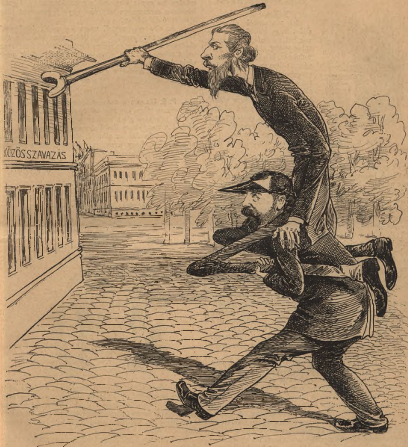
(A—nyi és U—ron hasznukra fordítják a régi mesét.)