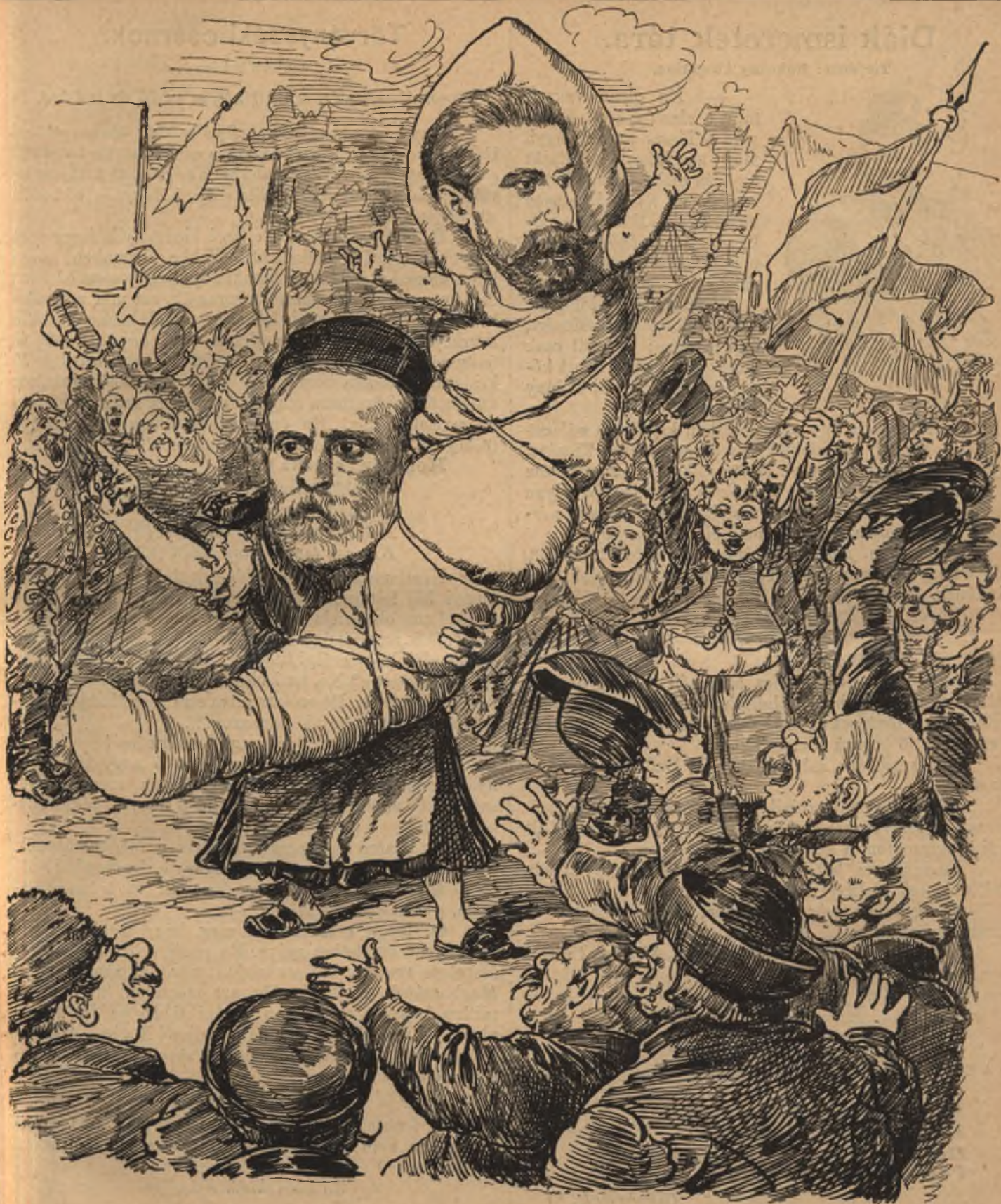
A hű dajka s az ő csecsemője N.-Szalontán.