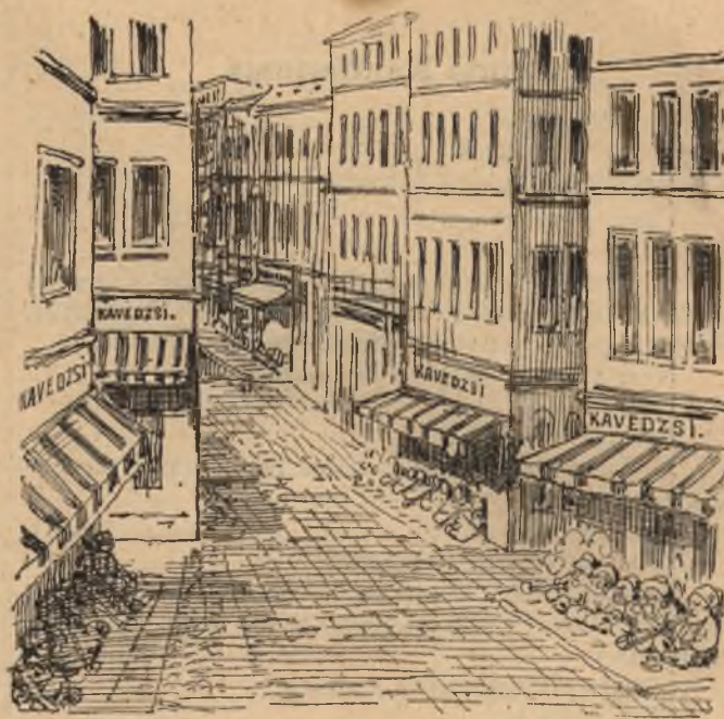
Törökvilág az Andrassy-uton.