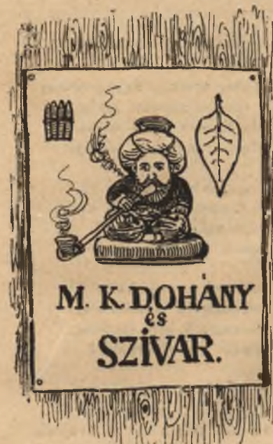
Az utolsó török.

Mi is találtunk Budapestén egy sereg olyan dolgot, amely a török uralomból maradt ránk és mi is föltaláljuk olvasóink- nak ezen a magunk specziális kiállításán.