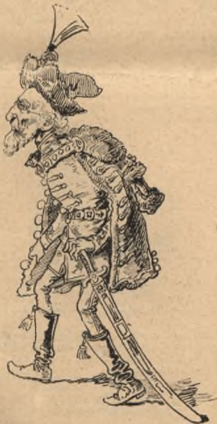
Görbe szikár testét kardon alig vonja, Hanem a beszédet ügyes ésszel fonja. („Buda halála“ III.)