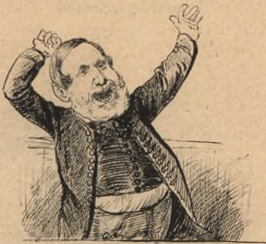
Jobban esik neki, ha egyet kiálthat. („A szegény jobbágy“.)