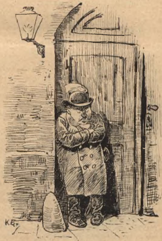
Egy, csak egy legény van talpon a vidéken. („Toldi“ I.)