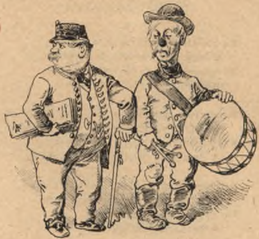
Ti, kikért teremnek a buzakeresztek! („Az alföld népéhez“.)