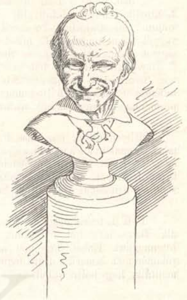
Előadás után boldogan mosolyog.