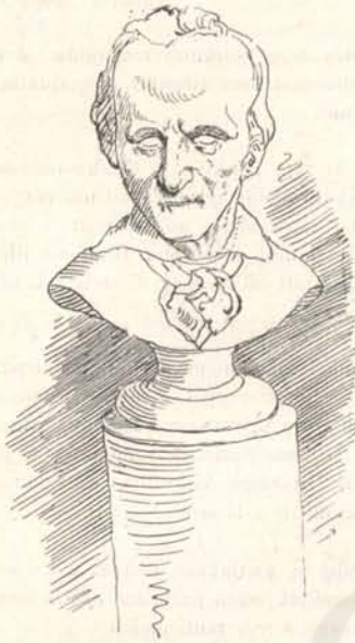
Előadás előtt nyájas.

A jó öreg Kazinczy az t. i., aki ott nézi, hallgatja télen nyáron a sok tudományos dolgot az akadémia kisebbik termében.