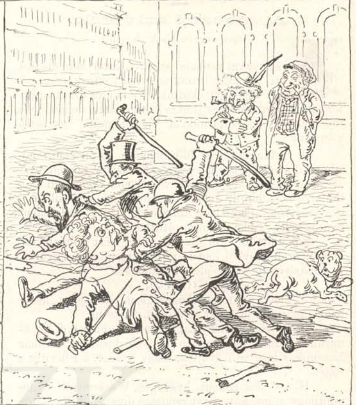
Mikor meg a zsidók örülnek.