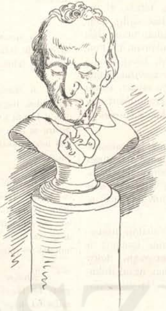
Előadás alatt megnyulik a képe.