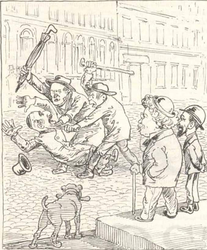
Mikor Verhovayék örülnek,