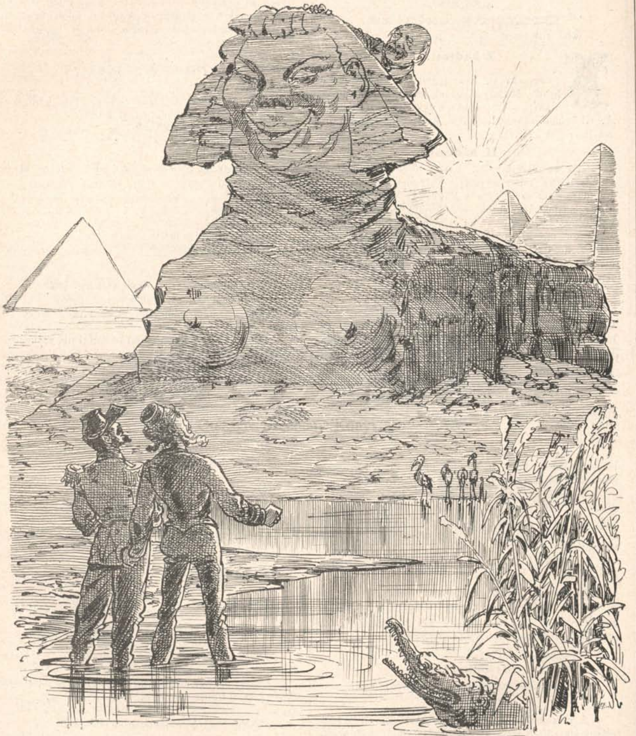
Az igazi Sphynx.