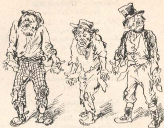
34. § . . . . vagy netáni birtokuk szerint perelhetők.