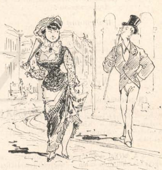
30. §. Személyes kereset.