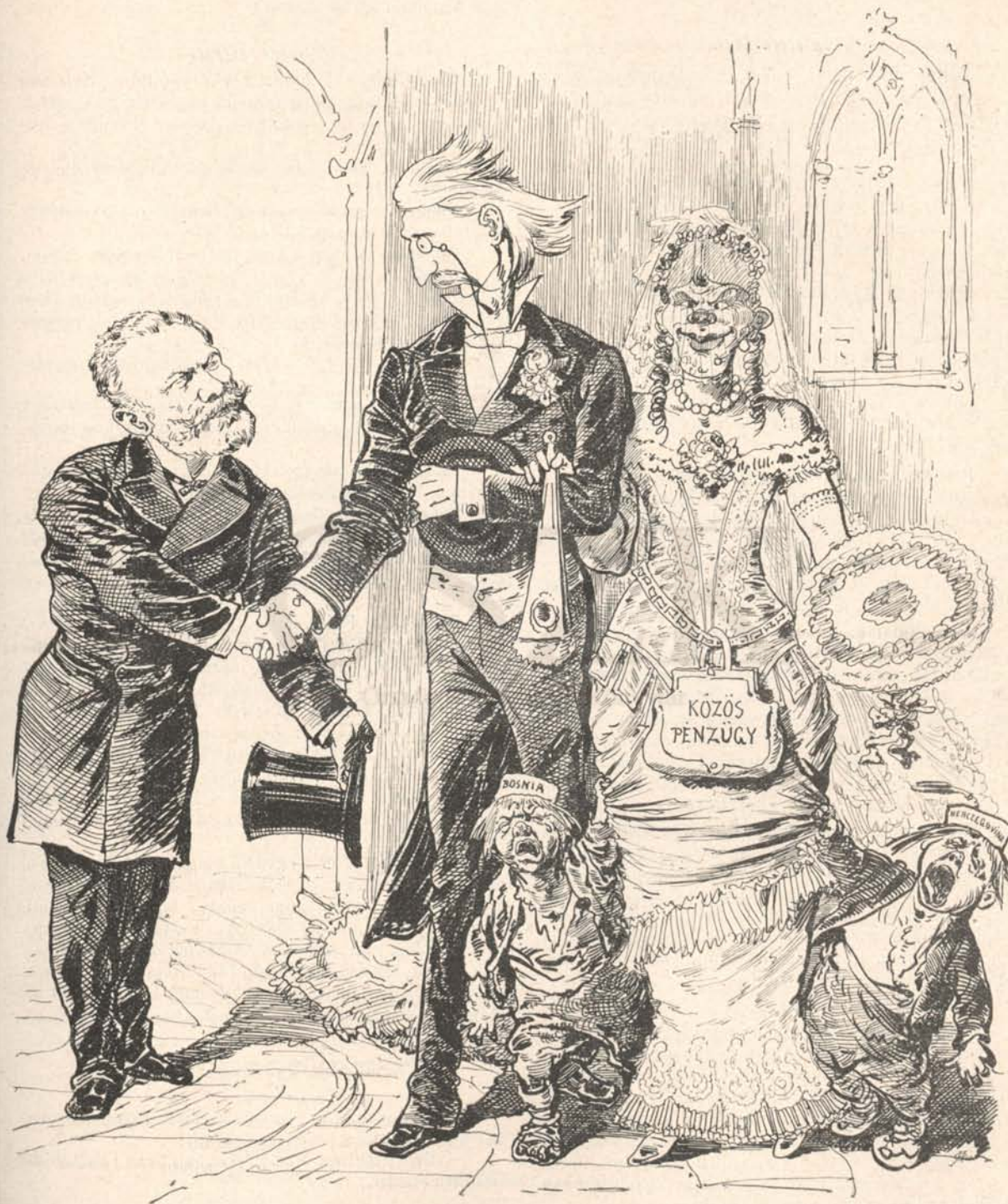
Sz—y J—f. Gratulálok, Bónikém!