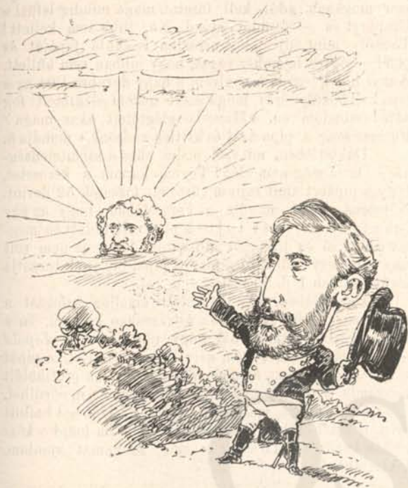
D—i L—s. Hurrah! Le soleil d'Austerlitz!...