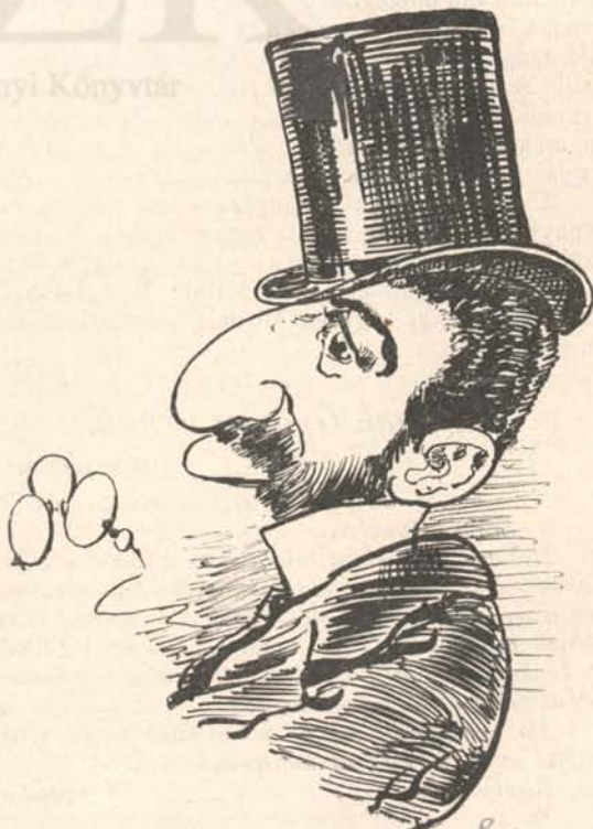
Kredit 100. 80