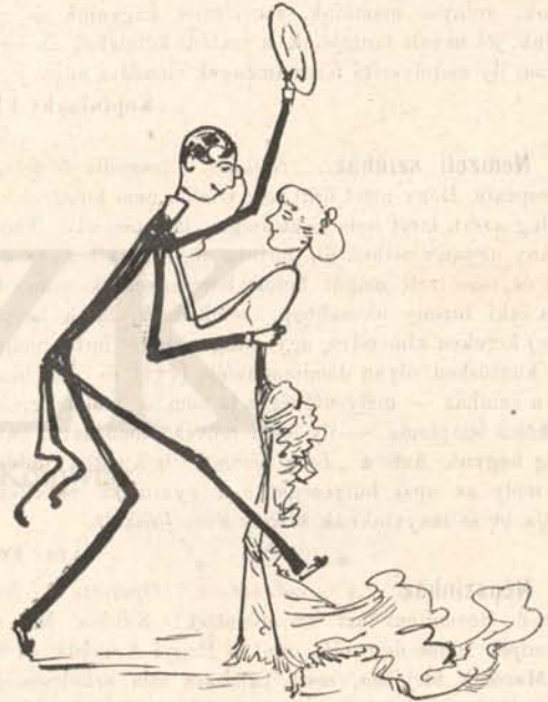
„Húzzad Pali, dísznót adok!”