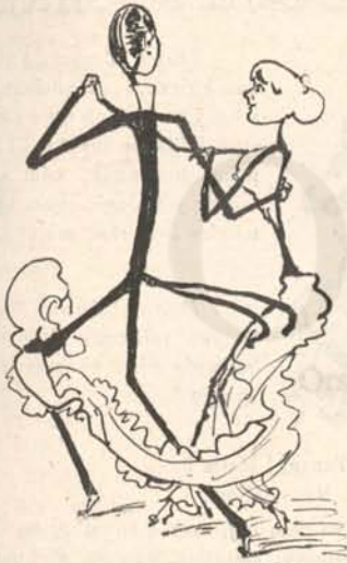
Még boldogabb forgás.