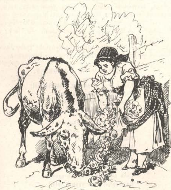
— minek következtében Zsuzska meg ölszám viszi a rózsát a számárnak.