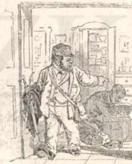
— Pakolj Pista!

Ha pedig a Mindenhatónak úgy tetszenék, hogy igénytelen nevem többé ne szerepeljen a képviselőház tagjainak lakjegyzékében — megnyugszom ebben is, mert tudom, hogy magul magom nem fog szakadni s míg magyar parlament lesz, mindig fog akadni felesen utódom, aki mehetnéki viszketegtől ösztökélve, kiáltani fogja helyettem is, hogy: