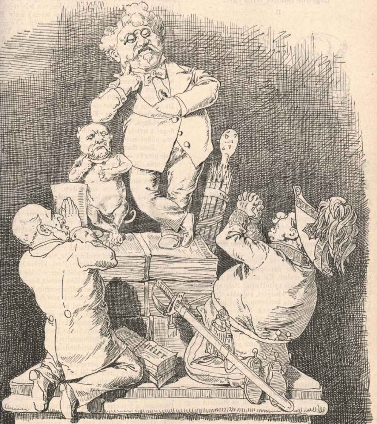
JVLIO. VERHOVINO. TRIVMPHATORI