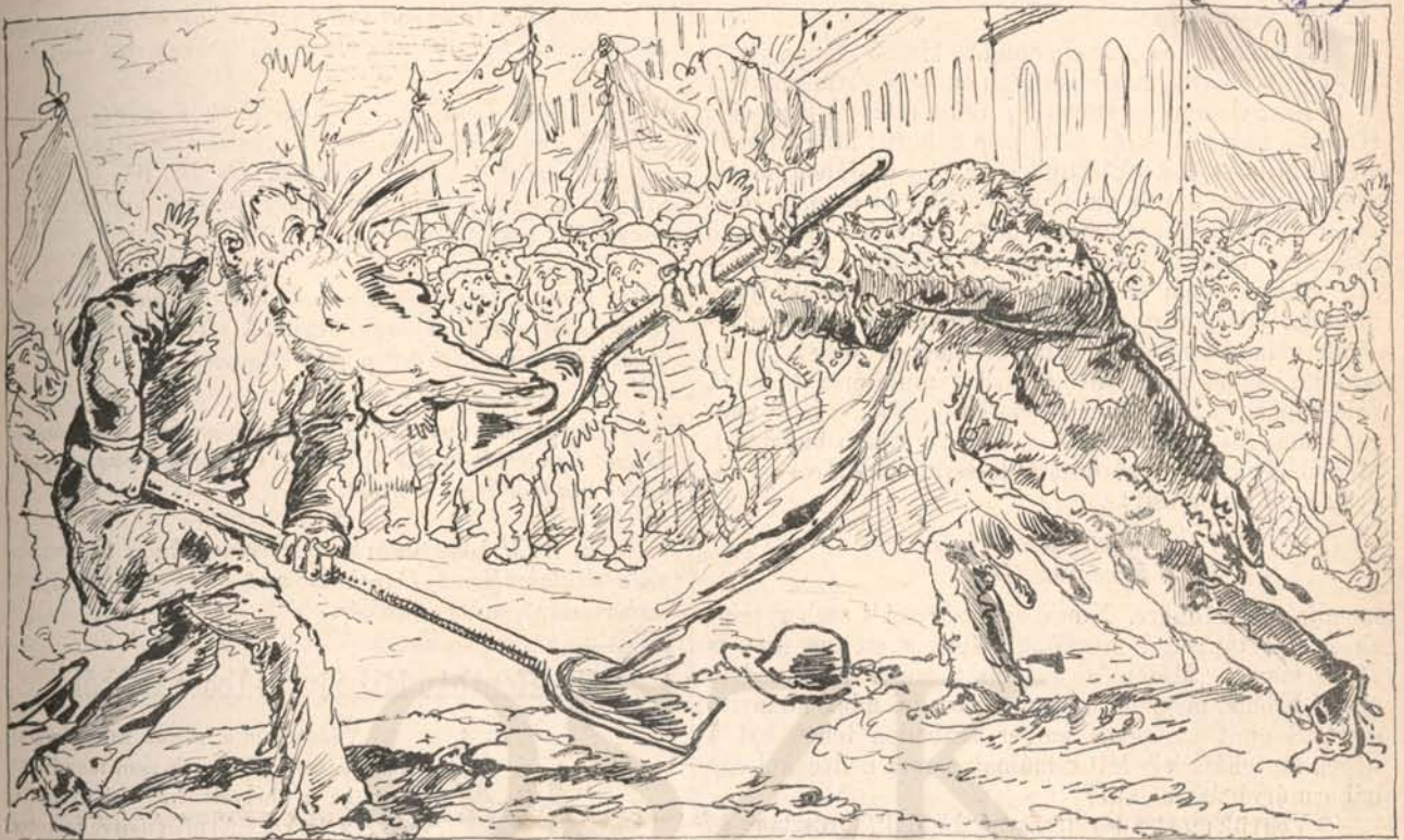
Az a két képviselő jelölt annyi sarat szór egymásra, hogy a tiszteletreméltó pártok nem is tudják már fölismerni, ki melyiké?