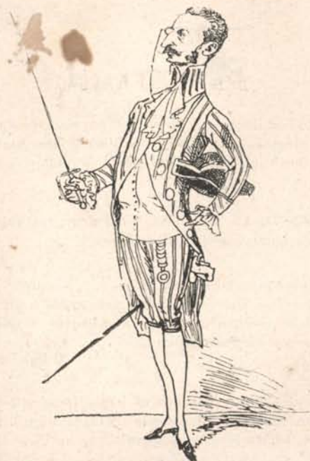
Sir John Asboth fleuretje — Kicsit használt, kicsit ártott: Piszkálgatásától pártlott Az országnak szemetje.