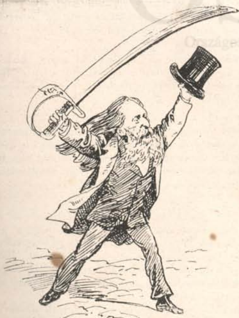
Szablyái, vad Hermann Ottója! — Hurka-metszés, urka-sértés, Siralmatos félreértés, Kő repül a Casinóba.