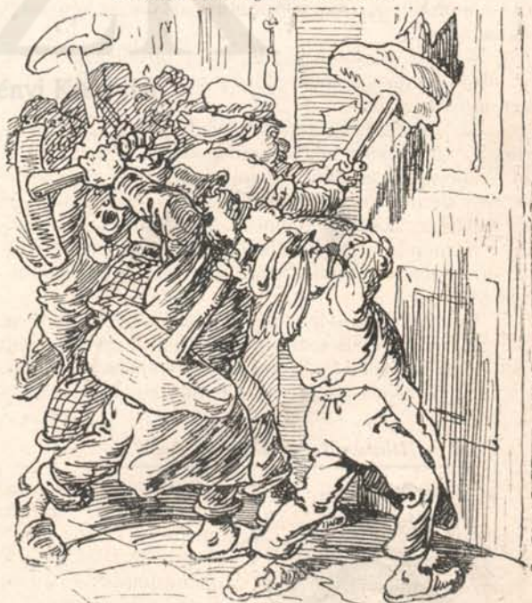
John spátéja, Ott' szablyája?... Buta, vad pörölygyé forrott: Azzal döngtet házat, boltot, Adta közös sociálja!