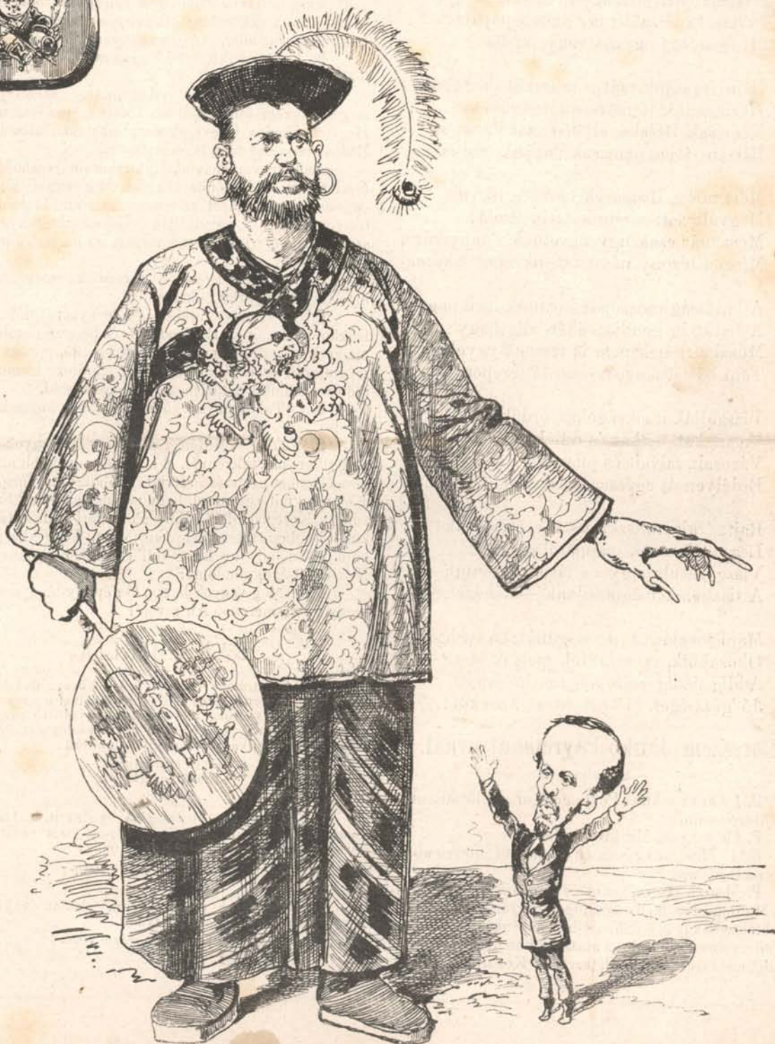
Szing-Lá-Gyide-Zső, a roppant kínai.