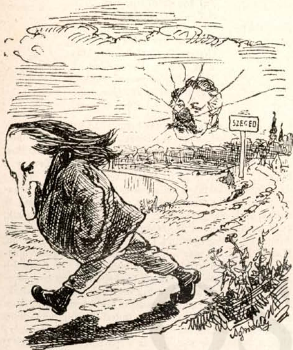
Az egyiké még jobban megnyult — a másiké meg annál vigabban tündököl.