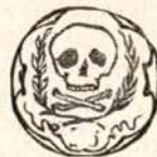
A szabadság ligája

Ha megmered szavazni a feliratot, jaj neked! Bűnhődni fogsz iszonyuan gyászvitézi érzelmeidért. Beszédeink tán csütörtököt mondanak, de petárdáink el fognak sülni.