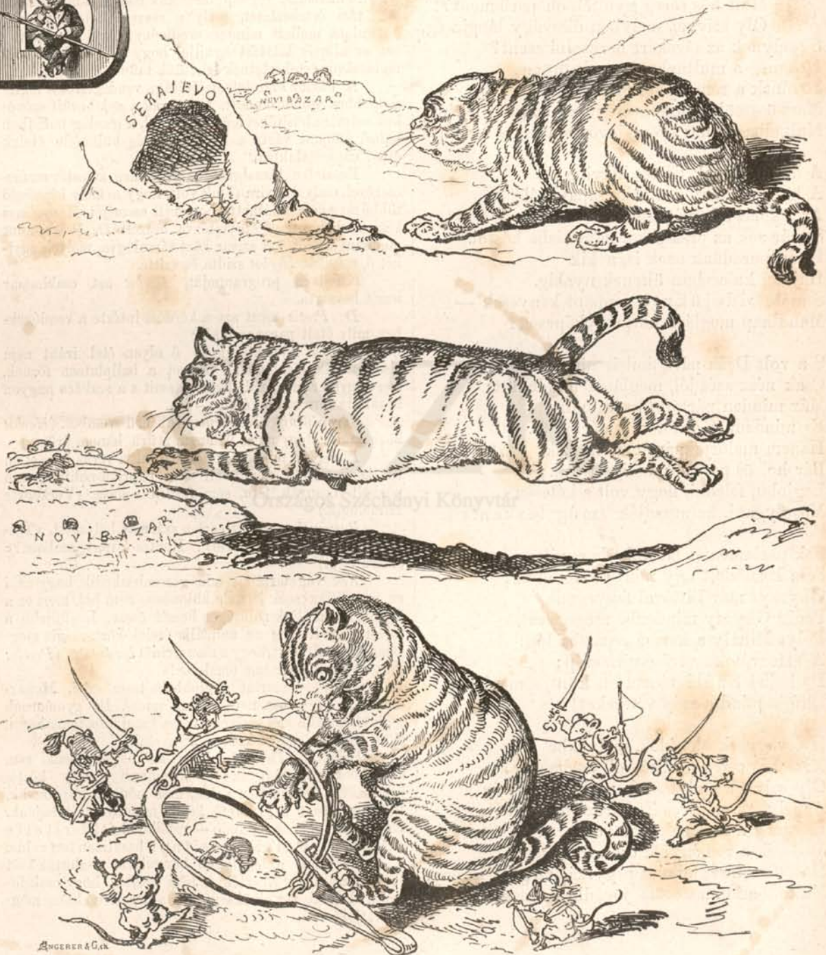
1. A cicza visszahúzódik, hogy azután — 2. még nagyobbat ugorják és hogy — 3. — — —