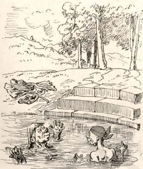
Tíz óra, negyven percz.