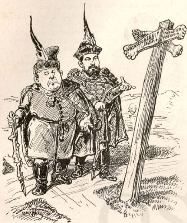
A követválasztások vándor-jogászaí.