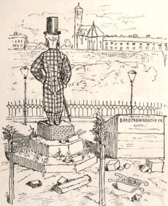
Csoda, hogy a Széchenyi-szobor árva piederstáljára még nem állt föl az elnök-báró — »vas úr«-nak.