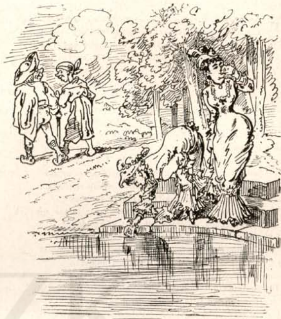
Tíz óra, ötven percz.