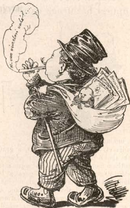
Czicielesz Borselesz *N*N, Palesztina hatalmasait és Jeruzsálem utcáit róva, körül fog sipolni, minden kapuba ezt kiáltva : »Mi van viczelni való?«