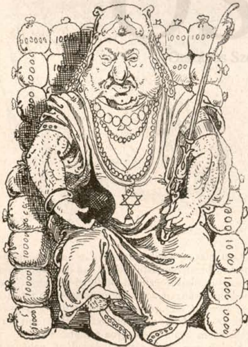
I. KÓBI a Rothschild nemzetségből, Zsidóország királya és pénzügy-ministere.