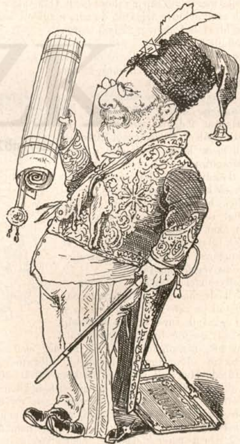
Hg. P. K. L. birodalmi konczellár, külüid miniszter, a rasztrirozott nemesi oklevelek föltalálója, az arany nyulbör grandja, a czvórach-rend alapítója, sarkantyós vitéz sat.