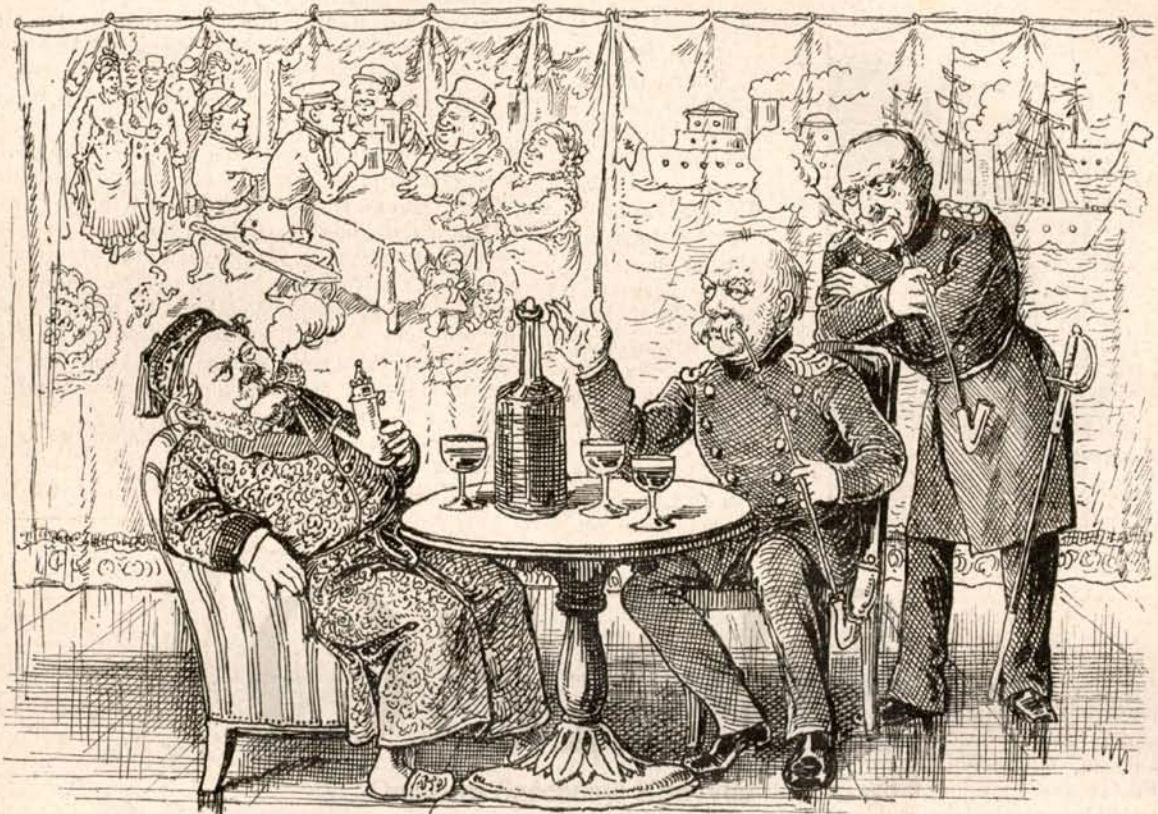
Az új német dicsőséget ilyenek festették.