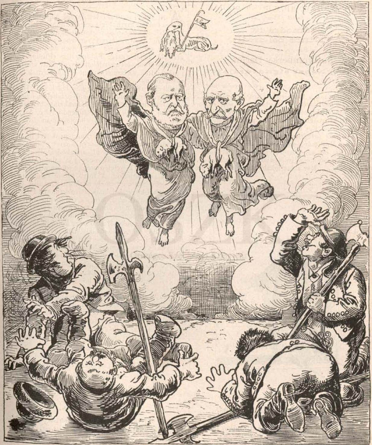
M—th Gy. és E—zy Mrez föltámadása.