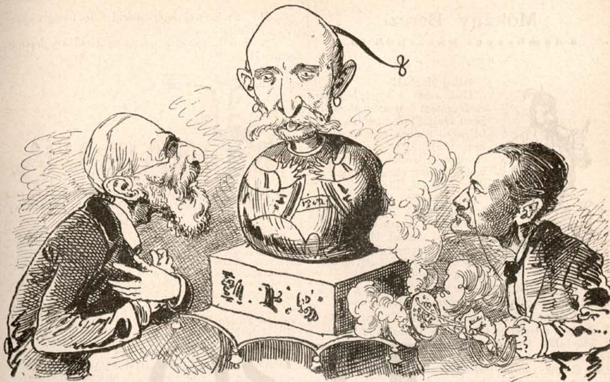
Az új bálvány.