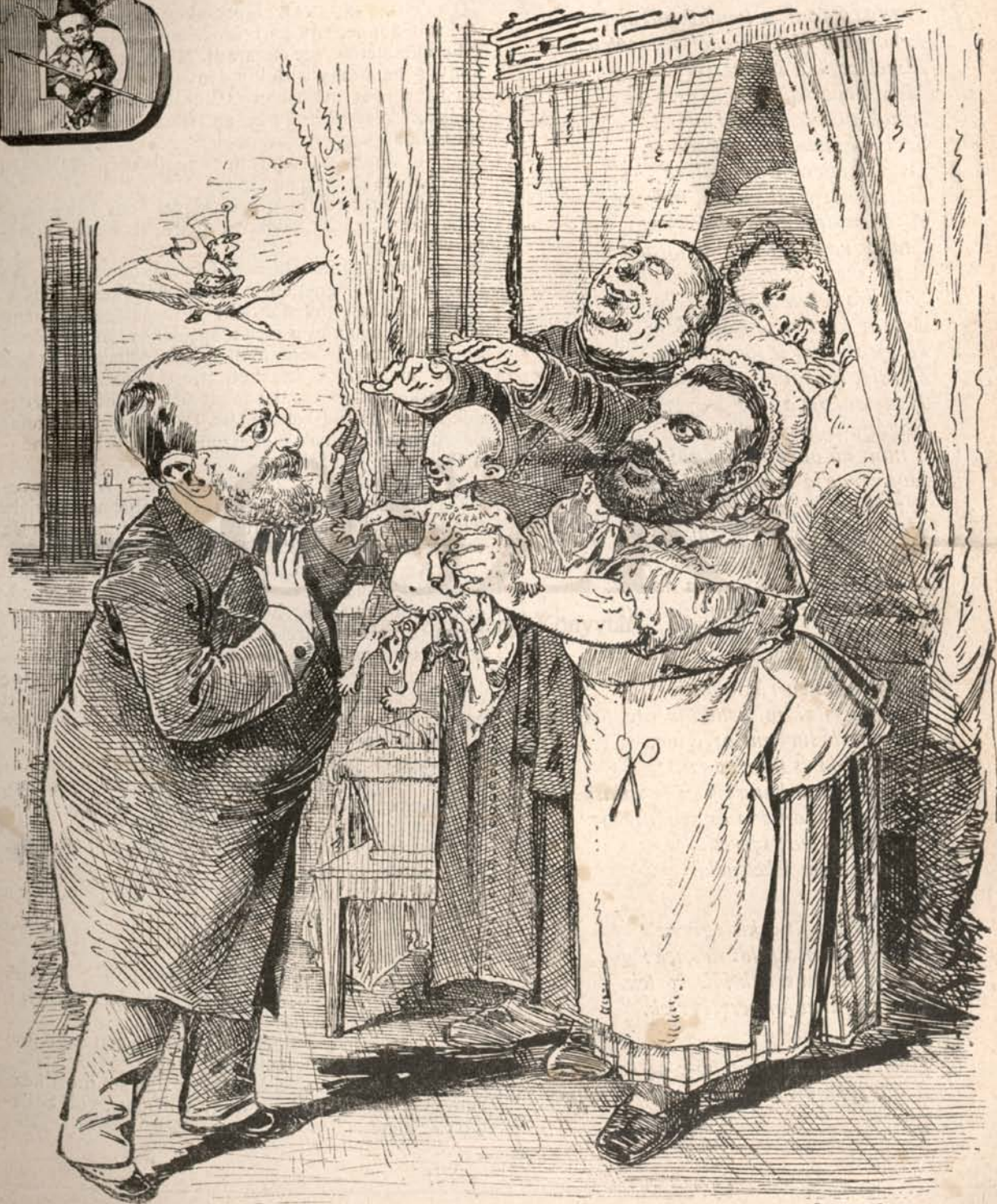
Az első szülött.

Előfizetni a kiadó-hivatalban: Budapest, Ferenciek-tere 7. sz. Előfizetési díj: Egész évre 8 frt. — Félévre 4 frt. — Negyedévre 2 frt.