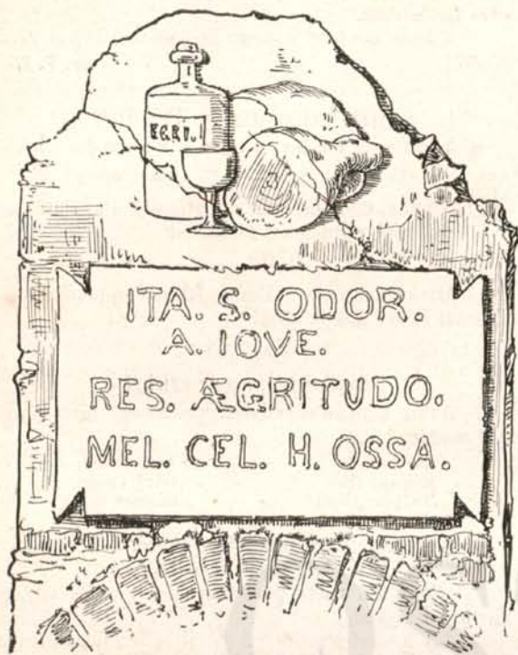
(Rómer Flóris lelete.)