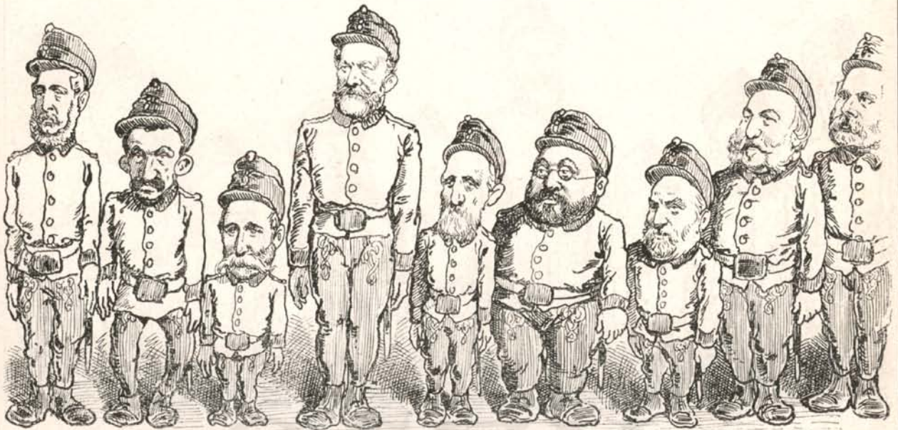
Ezek voltak a Szlávy-bakák.