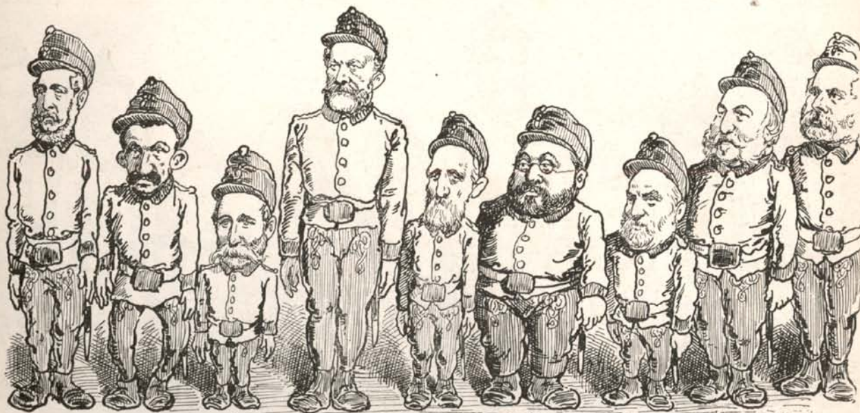
Ezek a Tisza K. bajnokai.