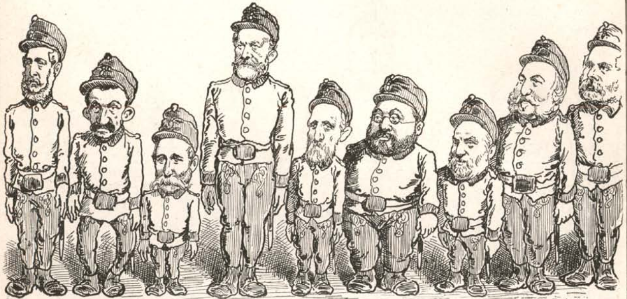
Ezek voltak a Bittó vitézek.