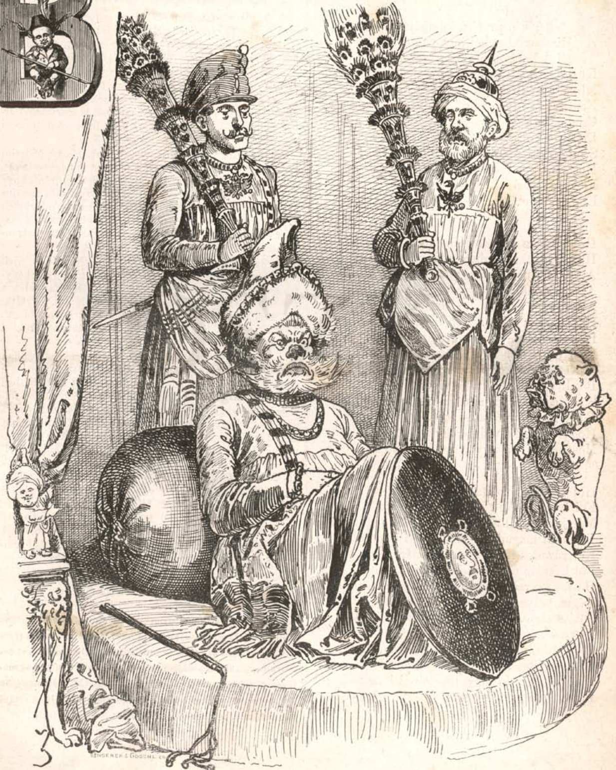
Kelet ura és az ő hű szolgálai.