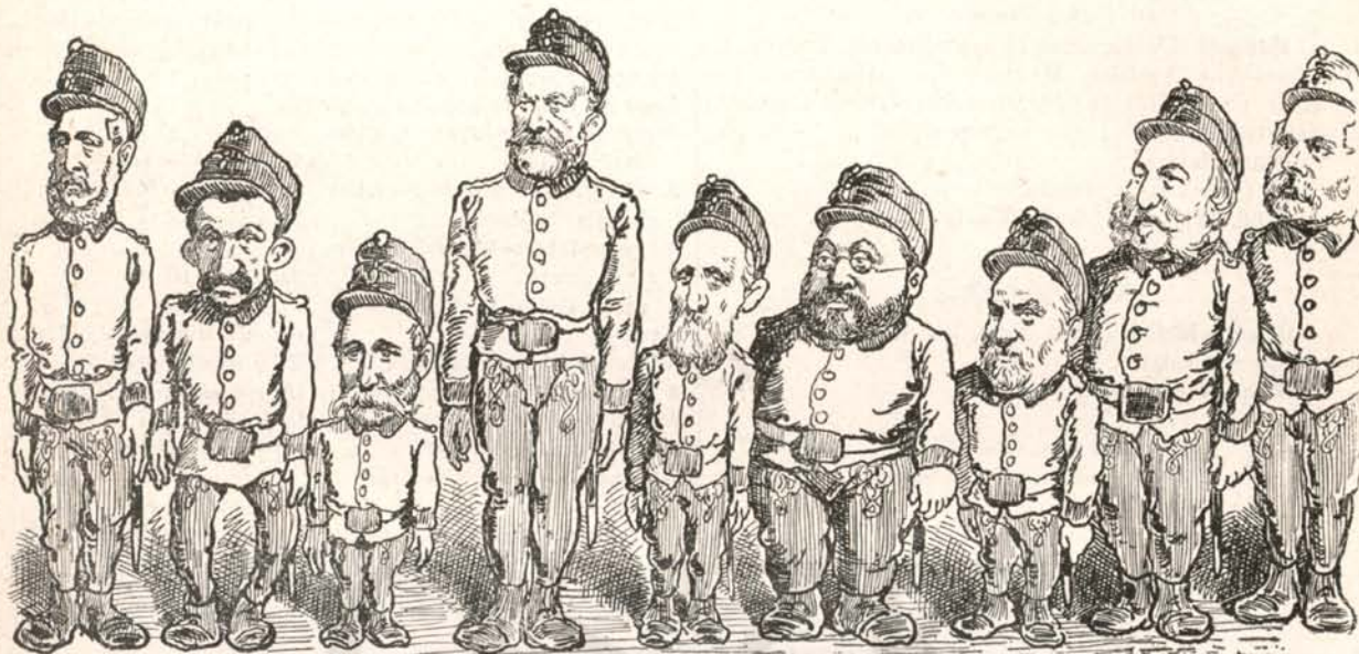
Ezek voltak a Deák katonái.