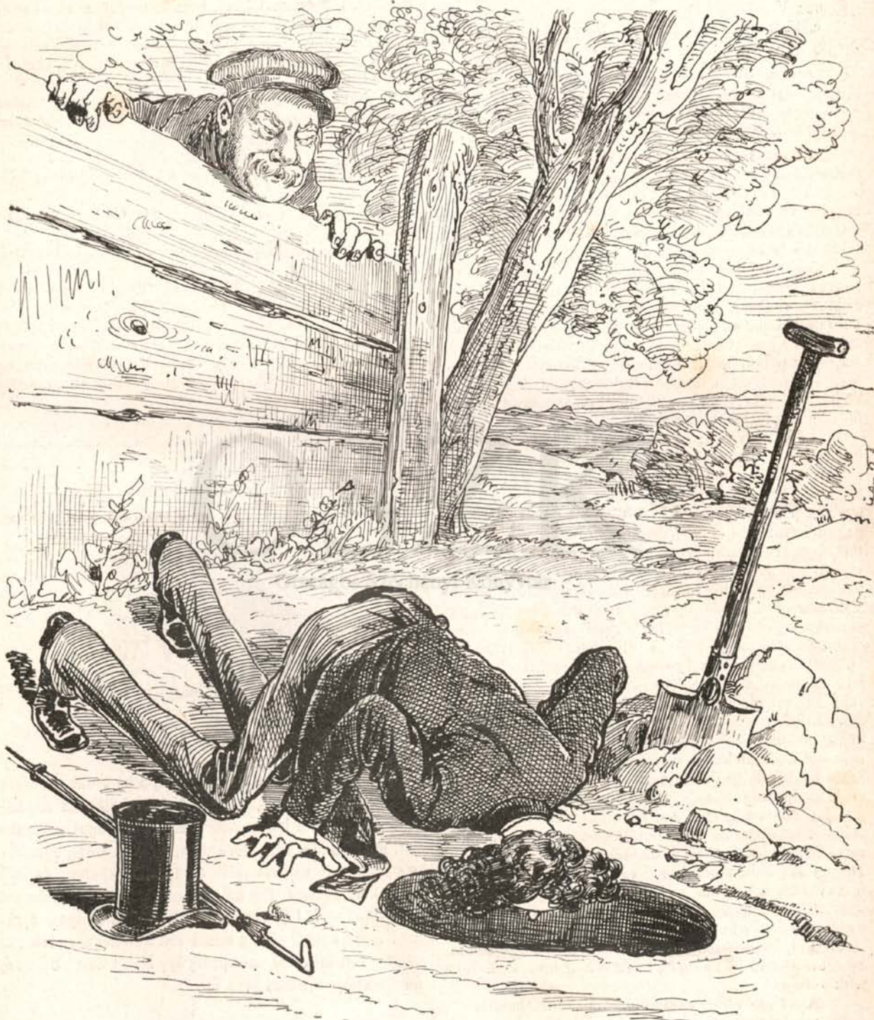
A—ynak ássa B—rk. A—y jól megnézi előbb, hogy bele ne essék; aztán óvatosan — belehág.