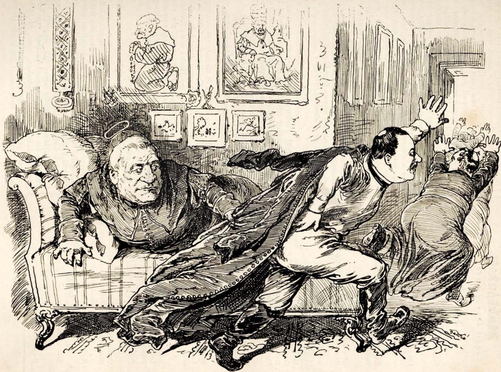
Setus Putipharus Fogarasynuz.