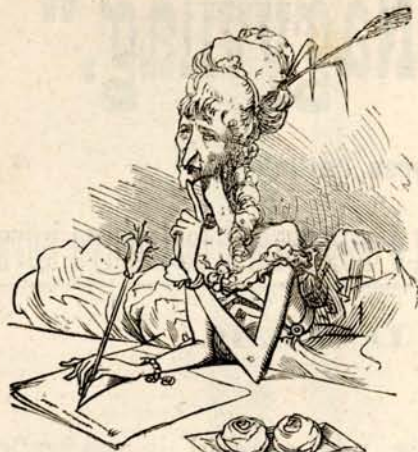
Lengenádfalván, éh-hó 28.