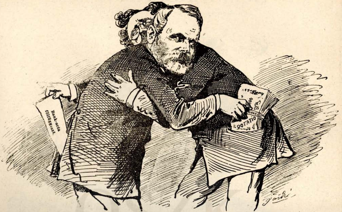
Kerkapoly és Depretis önzetlen ölekezése