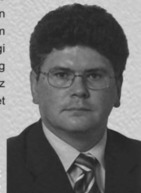
Becsey Zsolt EP-képviselő, FIDESZ

Másodszor, élni kell azzal a lehetőséggel, hogy a magyar nyelv európai uniós hivatalos nyelv, és a magyar állam uniós tagállam. Ez széles mozgásteret ad, például a kettős állampolgárság révén a politikai, sőt részben a jogi (ld. diplomáciai) védelem kiterjesztésének lehetőségét. Egyúttal az azonos nyelvi alapokon nyugvó gazdasági és regionális, kulturális együttműködésnek is széles lehetőségei nyílnak. Az ilyen együttműködés ugyanis a szubszidiaritás alkotmányos elvén alapul, és úgy valósítható meg, hogy nem lesz diszkriminatív a fogadó többségi nemzettel szemben. Az arányosság szintén uniós alapelv, és ezt az autonómiakoncepciókba szintén be lehet építeni.